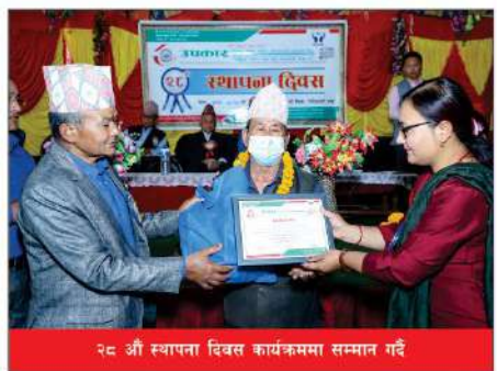
२८ औं स्थापना दिवस कार्यक्रममा सम्मान गदै