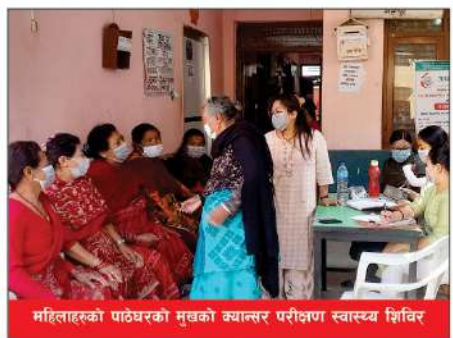
महिलाहरूको पाठेघरको मुचको क्यान्सर परीक्षण स्वास्थ्य शिविर