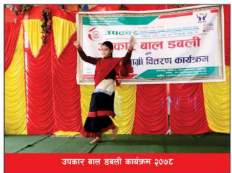
उपकार बाल डुबली कार्यक्रम २०७८