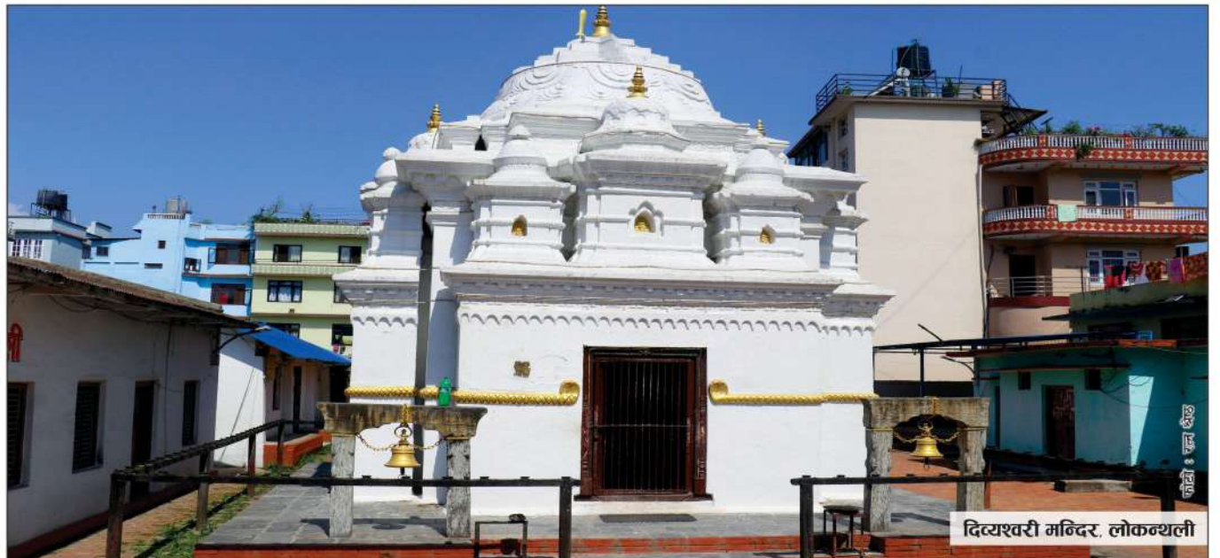
दित्यश्वरी मन्दिर, लोकनथली

उपकार बचत तथा ऋण सहकारी संस्था लि. ACCESS Upakar Savings & Credit Co-operative Society Ltd. BRONZE इसकाय बचत तथा ऋण सहकारी संस्था लि.