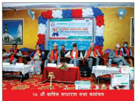
२८ औं वार्षिक साधारण सभा कार्यक्रम

सदस्य बन्नका लागि आवश्यक कामज पत्रहरू : • संस्थाको कार्य क्षेत्र मध्यपुर थिमि न.पा. वडा नं. १ र ३ याहिक। मित्र बसोवास गरेको। • संस्थाको विनियम तथा नीतिहरु पालना गर्न मञ्जूर भएको। • नागरिकताको प्रतिलिपि • हालै खिचेको फोटो २ वटा र हकबालाको फोटो १ वटा। • सम्माले जागि गरेको कम्तीमा ५ किता शेयर खरिद गरी सदस्यता शुल्क रु. २००/-, संस्था विकास शुल्क रु. १००/- र कन्याणकारी कोष रु. ५००/- र कम्तीमा महिनामा १००/- बचत बुझाउनु पर्ने।