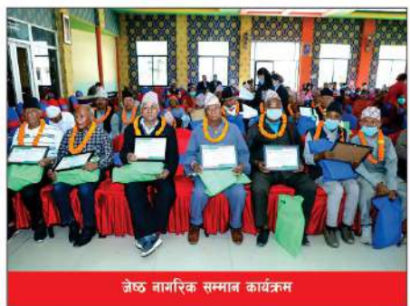
जेष्ठ नागरिक सम्मान कार्यक्रम

उपकार बचत तथा ऋण सहकारी संस्थामा नै सदस्यता किन ? विगत २८ वर्ष देखि अविजित सेवागत सन्धा सदस्यको चाहना अनुसारका बचत तथा ऋण सेवाहरू उपलब्ध हुने सन्धा उपकार ३ मीलको निम्नको ऋणको सुविधा भएको सन्धा उपकार शिक्षा पढ्क र उपकार प्रत्यक्षि प्रदान गर्दै ऋणको सन्धा सदस्य तथा सदस्यका एक-परिवार विगत प्रथम राहत प्रदान गर्ने सन्धा सदस्यलाई २४ ६ घण्टा बचत फिर्ता गर्ने व्यवस्था भएको सन्धा डिजिटल सहकारी कार्यालय भक्तपुरबाट २०१६/०५४ र २०२२/०५६ मा "मनुष्य सहकारी" घोषित भएको सन्धा डिजिटल सहकारी कार्यालय भक्तपुरमा २०१६/०५६ मा उन्कट सहकारी घोषित भएको सन्धा बिनीय अनुशासन कायम गर्ने पुरोस्वने Picotis अनुशासन प्रणाली लागू गरेको सन्धा एशियानी ऋण महासङ्घद्वारा संचालित अन्तर्राष्ट्रिय मापदण्डमा पुग्न ACCESS Branding (प्रतिक्रिया प्रिस्ट्रुन नभै) कार्यक्षमता सहभागी भई ACCESS BRONZE प्राप्त सन्धा नेपाल बचत तथा ऋण केन्द्रिय सहकारी संघ(नेफ्स्कून) र जिल्ला बचत तथा ऋण अड्डा भएको सन्धा आफ्नै भक्तपुर सदस्यलाई सेवा प्रदान गर्दै ऋणको सन्धा नेपाल बचत तथा ऋण केन्द्रिय सहकारी संघ लि. (नेफ्स्कून) द्वारा मायामाञ्जन शंभुको उन्कट सहकारी घोषित सन्धा राष्ट्रिय सहकारी बैंक लि. माट २०७१/०८/२९ मा काठमाडौं उन्कटको उन्कट सहकारी संस्थाका सन्धा प्ररम्भ ।