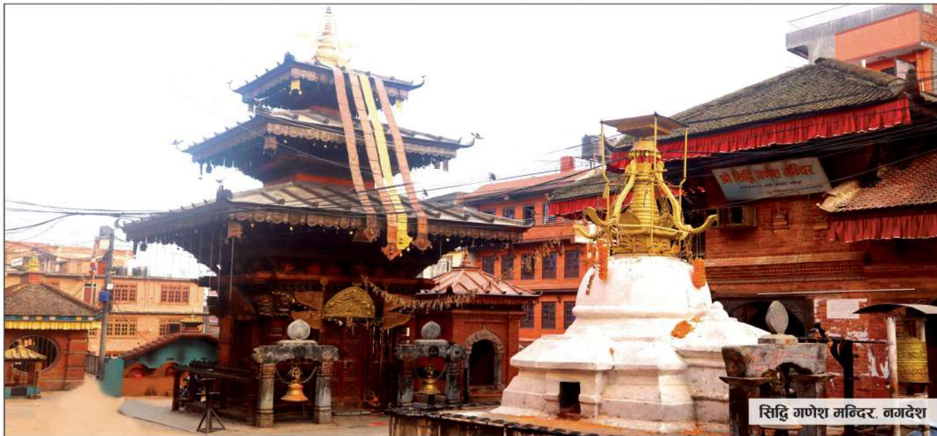
सिद्धि गणेश मन्दिर, नगदेश

ACCESS BRONZE MEMBER OF THE NATIONAL CONFEDERATION OF CO-OPERATIVES