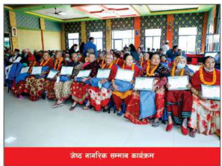
जेठ नागरिक सम्मान कार्यक्रम