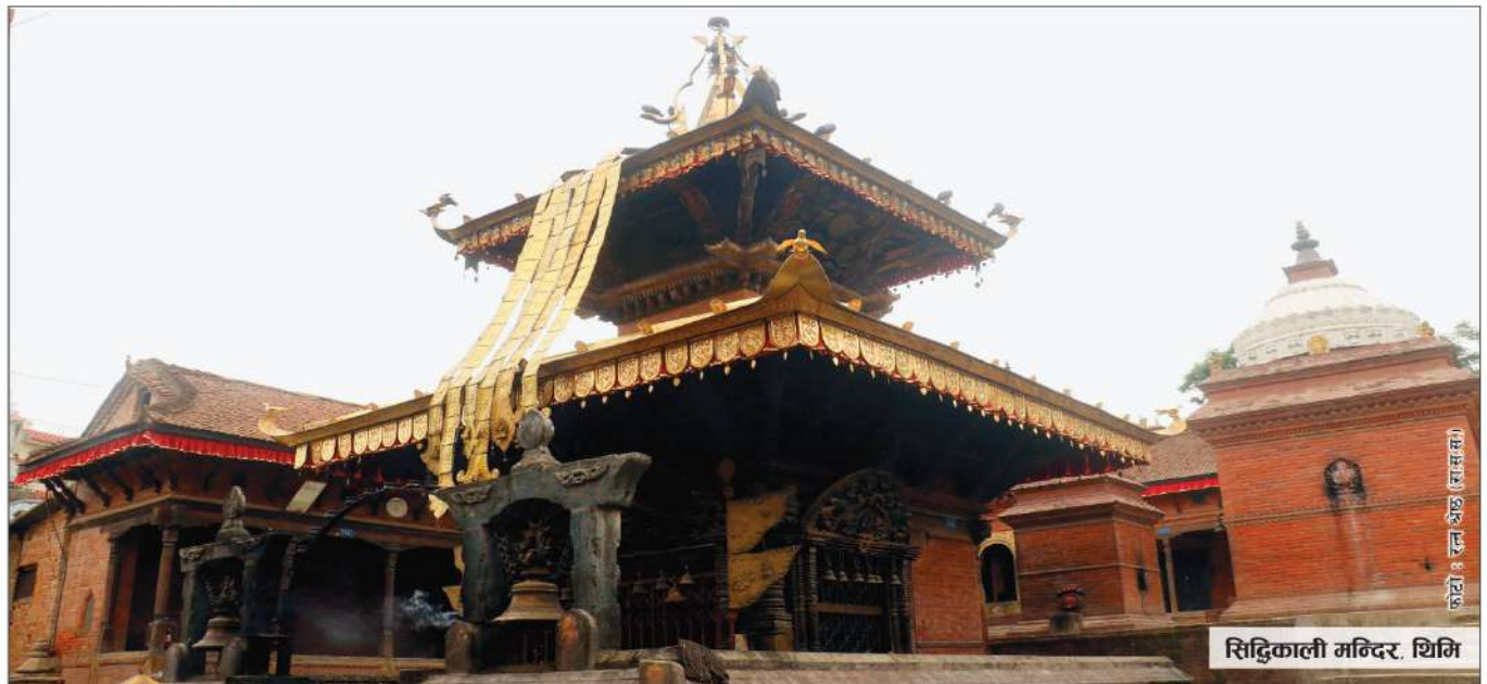
सिद्धिकाली मन्दिर, थिमी

उपकार बचत तथा ऋण सहकारी संस्था लि. ACCESS Upakar Savings & Credit Co-operative Society Ltd. BRONZE इसकब बचत तथा ऋण सहकारी संस्था लि.