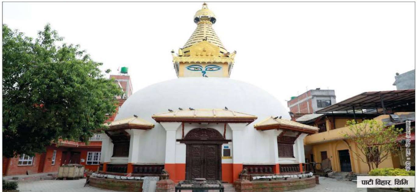
पाटी विहार, थिमी

उपकार बचत तथा ऋण सहकारी संस्था लि. ACCESS Upakar Savings & Credit Co-operative Society Ltd. BRONZE इसकब दवत तबा सुय मदखनी मेशा लि.