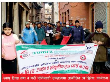
ज्यापु दिवस तथा य.म.री.पु.पु.मा.को उपलक्ष्यमा आयोजित न्य.घि.च. कार्यक्रम