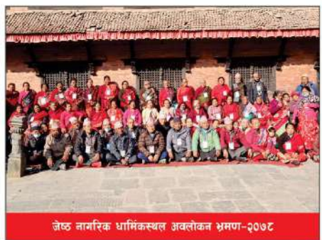
जेष्ठ नागरिक धार्मिकस्थल अवलोकन भ्रमण-२०७८