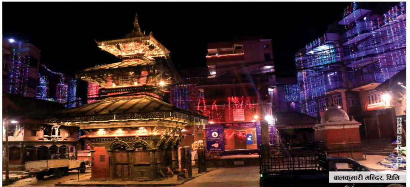
बालकुमारी मन्दिर, थिमी

उपकार बचत तथा ऋण सहकारी संस्था लि. ACCESS Upakar Savings & Credit Co-operative Society Ltd. BRONZE इसकब दवत तबा मूय मदखनी मेशा लि.