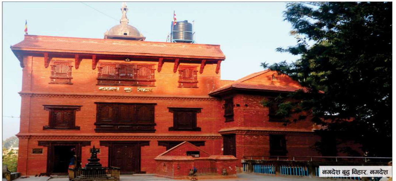
नगदेश बुदु विहार, नगदेश