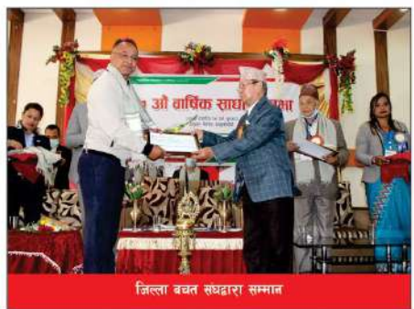
जिल्ला बचत संघद्वारा सम्मान