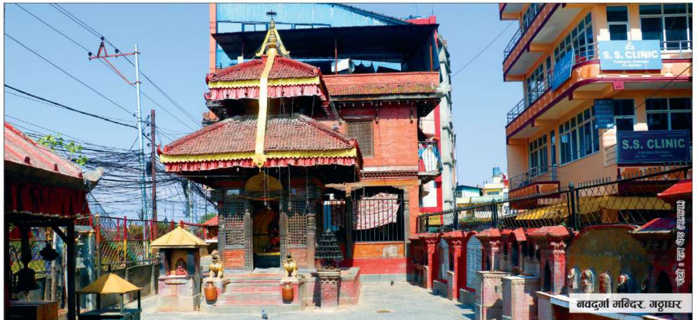
नवदुर्गा मन्दिर, गठुघर

उपकार बचत तथा ऋण सहकारी संस्था लि. ACCESS Upakar Savings & Credit Co-operative Society Ltd. BRONZE डि.स.का.भ.पु.वन.नं. २२/०५१/०५२