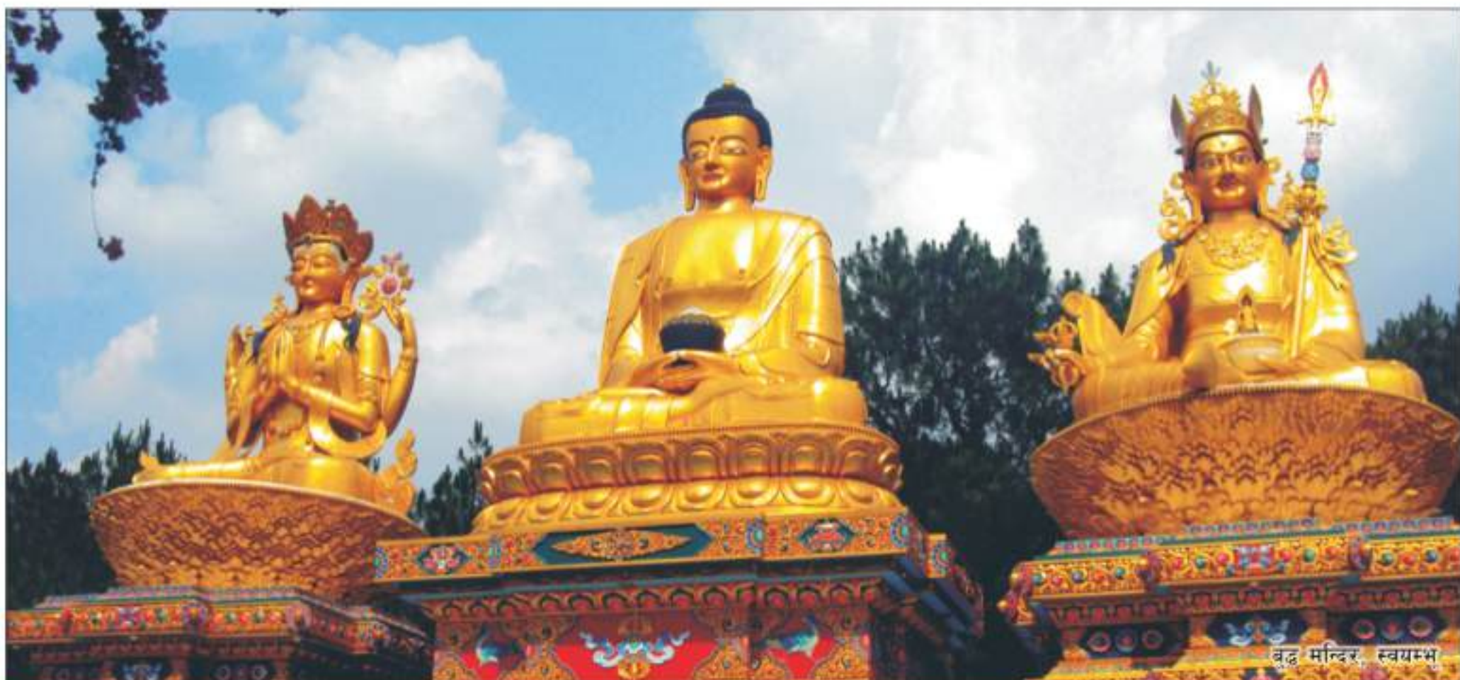
बुद्ध मन्दिर, स्वयम्भू