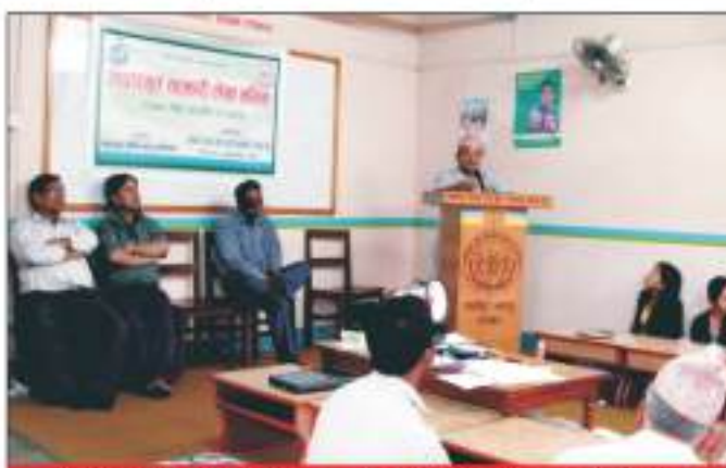
मध्यपुर थिमि नगरपालिकासँगको सहकार्यमा मध्यपुर क्षेत्रभित्रका सहकारीहरूका लागि आयोजित आधारभूत सहकारी सेवा तालिम