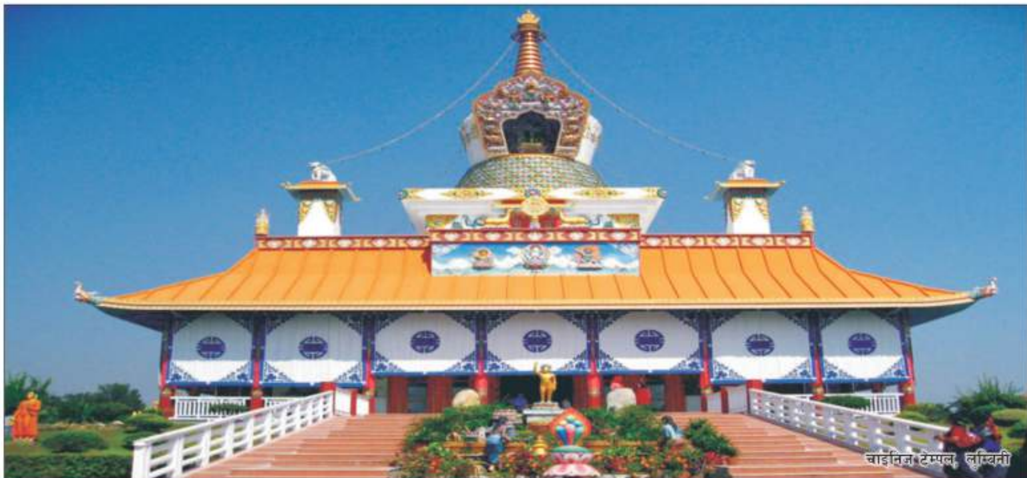
चाईनिज टेम्पल, लुम्बिनी