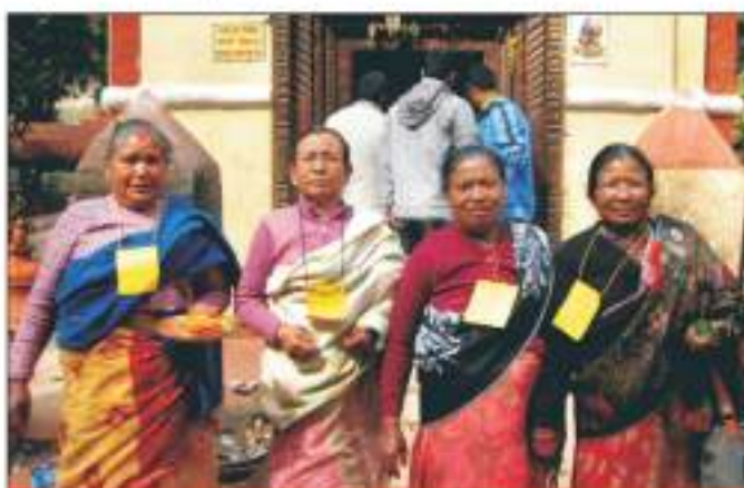
जेठ नागरिक सवस्य समणका सहभागी जेठ नागरिक सवस्यह