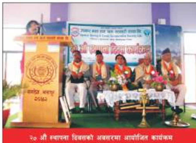
२० औं स्थापना दिवसको अवसरमा आयोजित कार्यक्रम