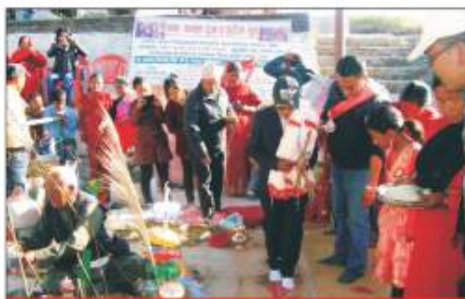
शिव महादेव विष्णु तीर्थ विकास सम्बासंगको सहकार्यमा आयोजित सामूहिक ब्रतकथ तथा शैव विवाह कार्यक्रम