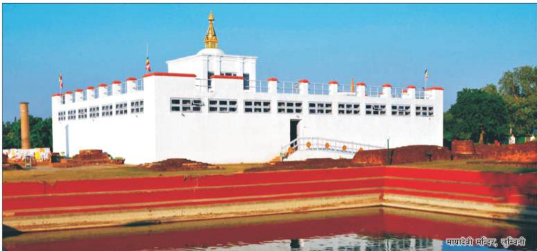
मायादेवी मन्दिर, लुम्बिनी