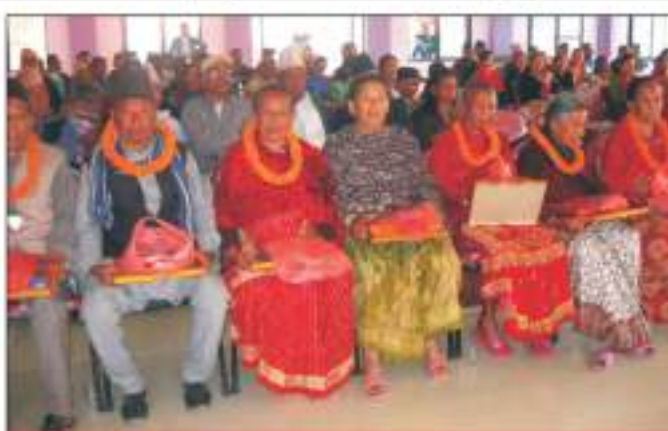
२० औं स्थापना दिवसको अवसरमा आयोजित कार्यक्रममा सम्मानीत नेष्ठ नागरिक सदस्यहरु