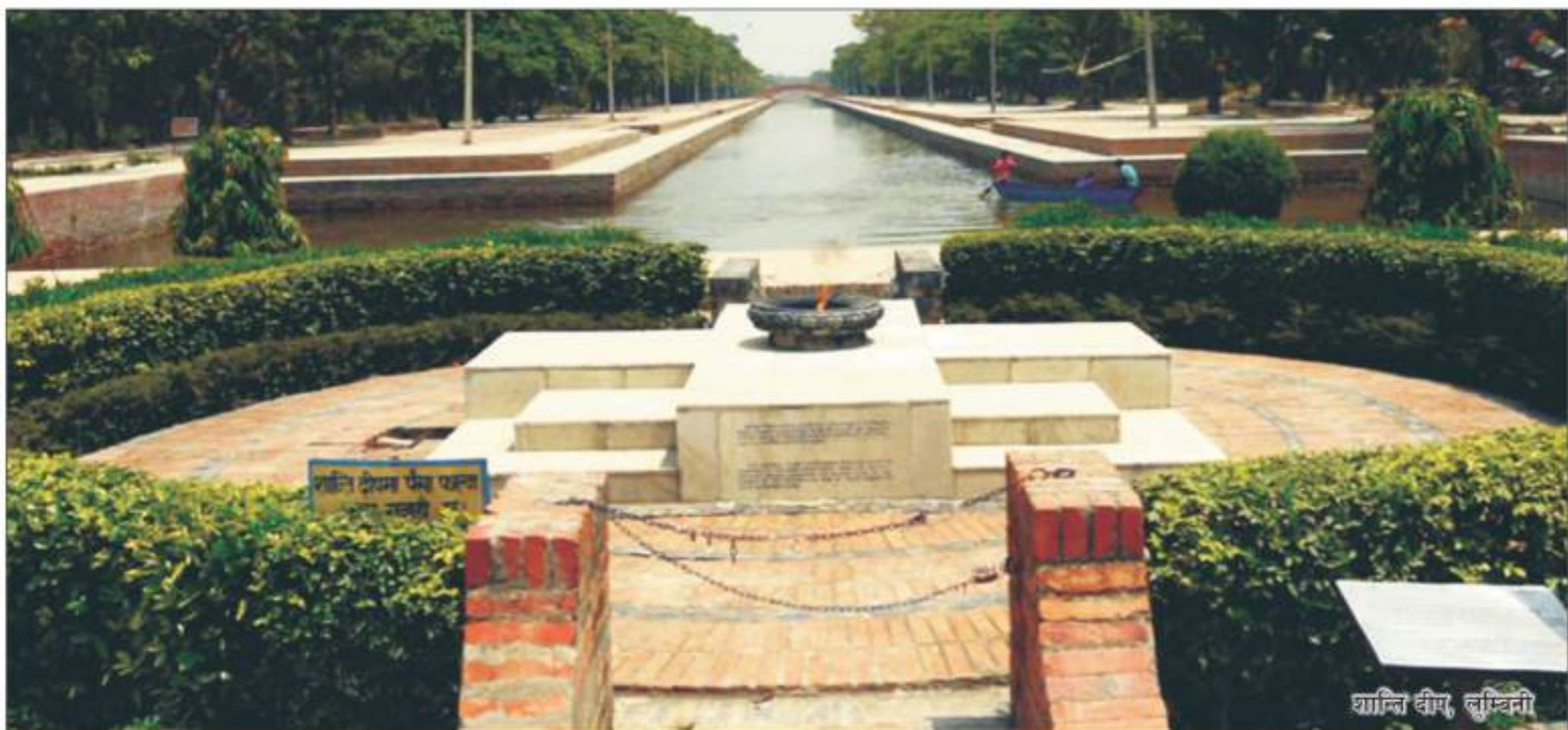
शान्ति वीथी, लुम्बिनी