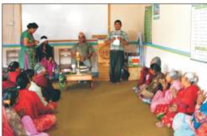
मातृजीवनीका दिन जाजोबिल जेठ नागरिक (महिला) सम्मान (मूख हुने) कार्यक्रम